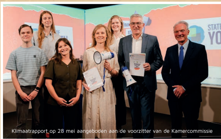
Klimaatrapport op 28 mei aangeboden aan de voorzitter van de Kamercommissie

waarbij hun stem niet eenmalig wordt gehoord maar structureel wordt meegenomen in beleid dat hen direct raakt. Dat is precies de infrastructuur die State of Youth NL biedt - en die we verder blijven uitbouwen.